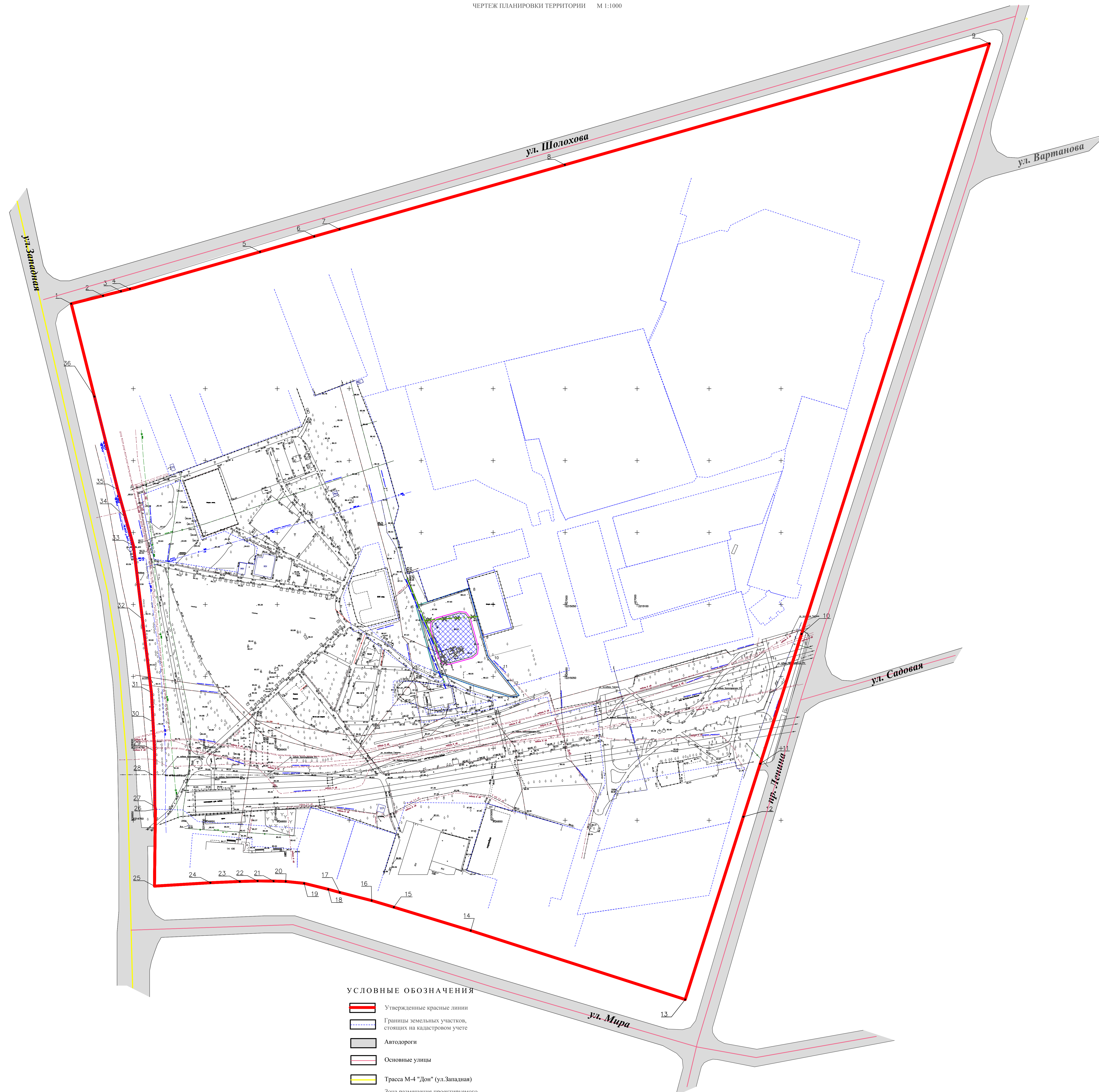
Каталог координат красных линий