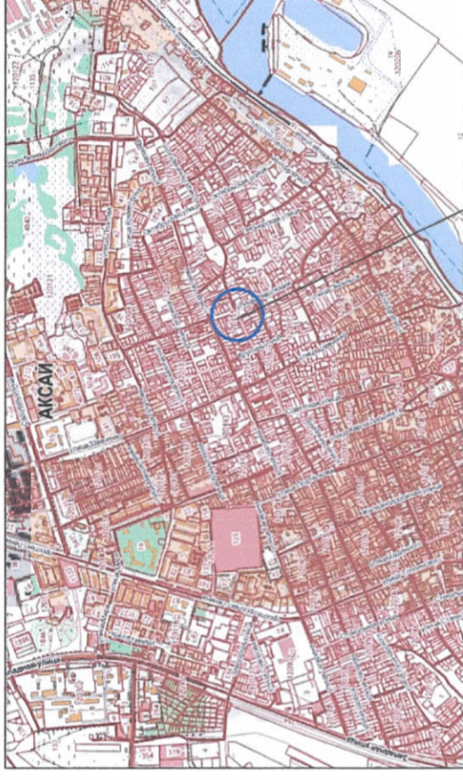
место размещения земельного участка