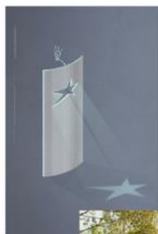
Зона фотостендов Стнды расположены по кругу